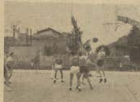
Flagrante do jogo de Bola-ao-cesto