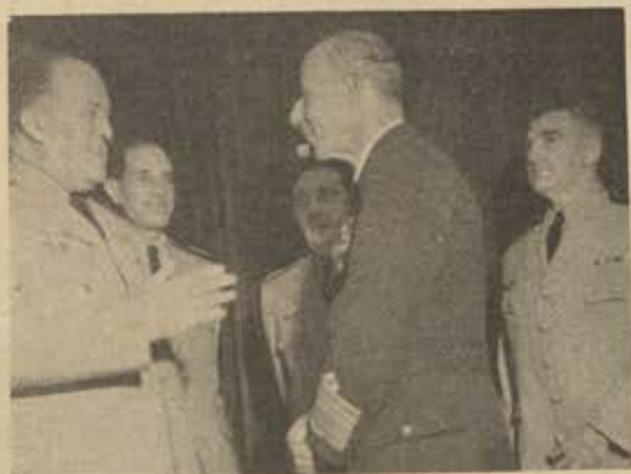
O Brigadeiro Bartolomé de La Colina, quando de sua visita ao Gabinete do Ministro Armando Trompowski de Almeida, com quem manteve cordial palestra. No clichê um flagrante tomado durante a visita, que se prolongou por mais de 40 minutos