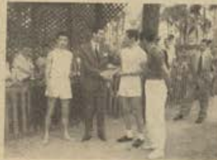
Entrega de prêmios ao 1.º e 2.º colocados da A. F. E. T. Av.