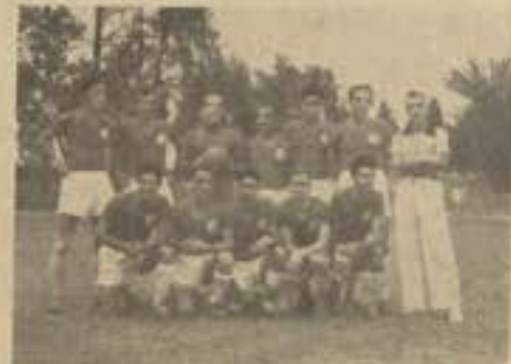
Quadro do América F. C.