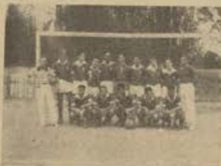
Seleção dos Funcionários da E.T. Av.