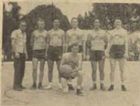
Quadro de Bola-ao-cesto dos norte-americanos da E.T. Av.