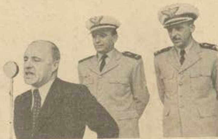
"Termo, desejando-vos muitas felicidades!"