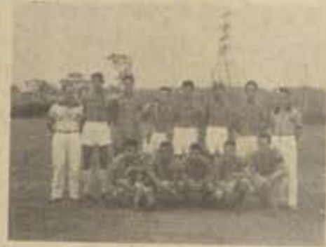
Quadro de Aspirantes do América F. C.