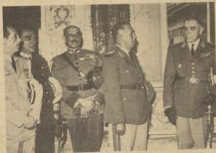
Aspecto da transmissão de comando da 2.ª Região Militar