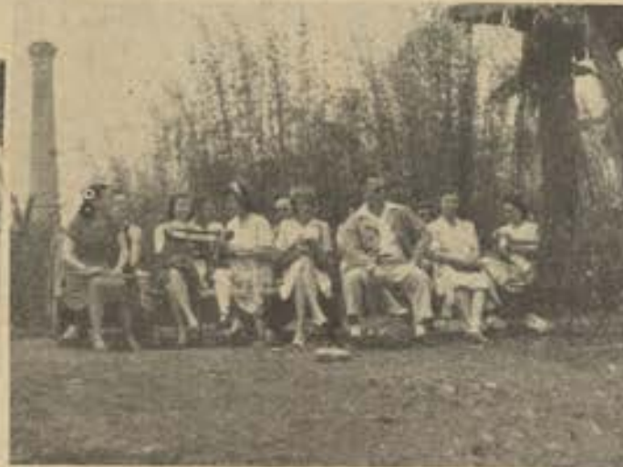
Aspecto pitoresco de assistência