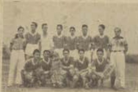
Quadro dos Aspirantes da Escola