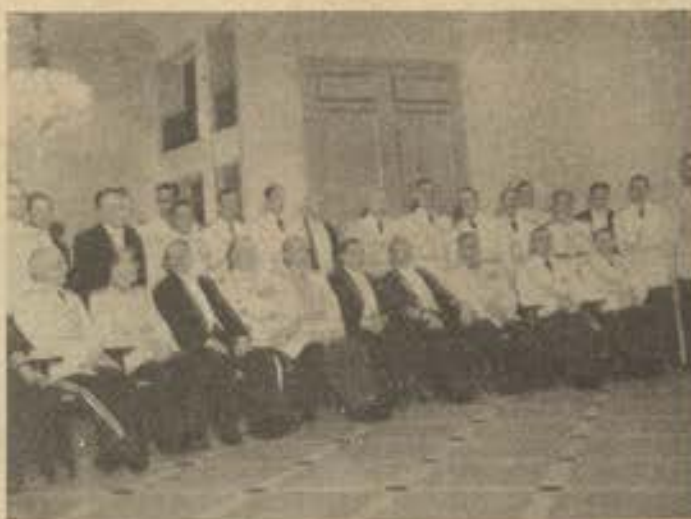
Aspecto geral dos participantes do Banquete oferecido pela F.A.B. no Copacabana-Palace, vendo-se no centro o Titular da Pasta da Aeronáutica ao lado do seu colega da República Argentina