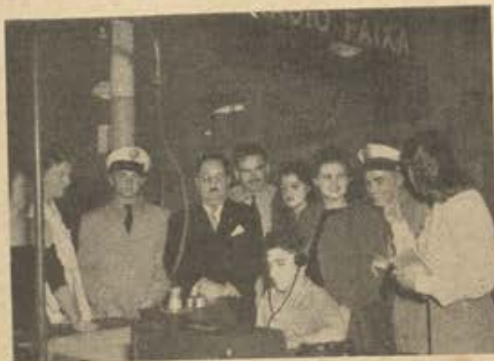
No Depto. de Link Trainer