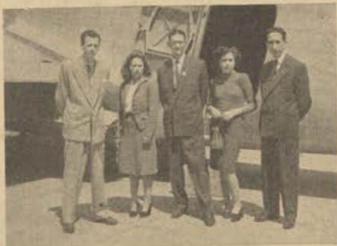
Os visitantes no Depto. de Estruturas Metálicas